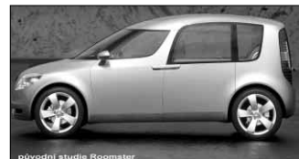
původní studie Roomster

Pro srovnání přidávám americký Pontiac Trans Sport, sériově vyráběný od r.1989, a ruský koncept Moskvic Arbat z r.1990. Jistě to není jediný příklad hledání jinak vyjádřeného tvaru podélně skříň se šikmým náběhem kokpitu a motorové části s pohonem předních kol, aby měl zadní díl nerušený prostor pro užitkovou variabilitu, ale je to dobře pochopený vývojový směr, kterým se dnes zabývají snad všechny